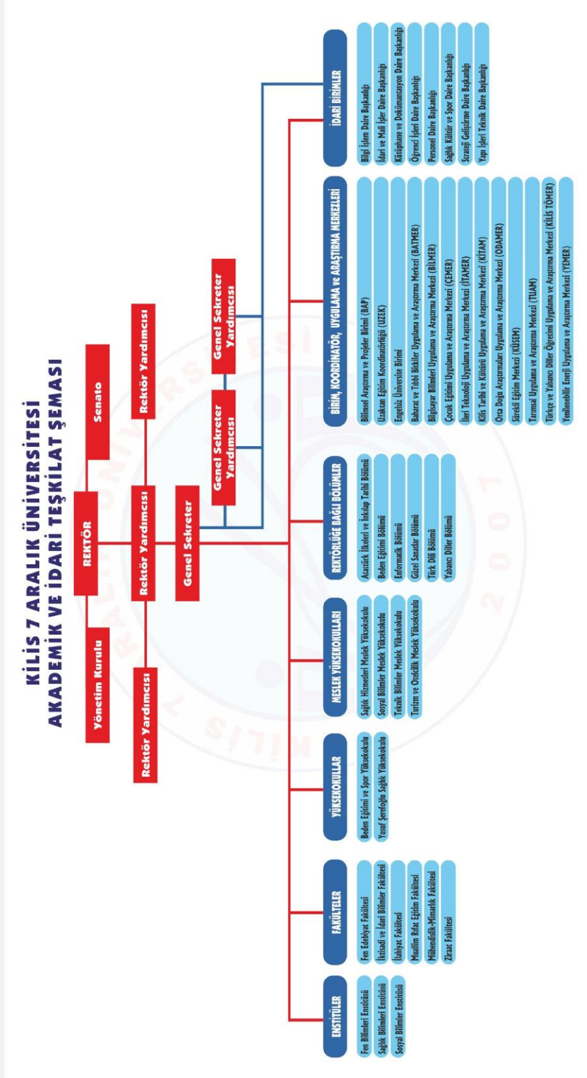
Şekil 1- KIYÜ Akademik ve İdari Teşkilat Şeması

Üniversitemiz idari ve akademik organizasyon şeması