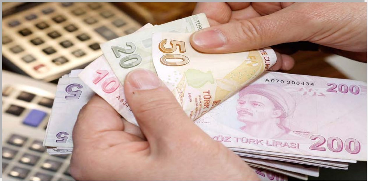
Tablo 23- Bütçe Giderleri